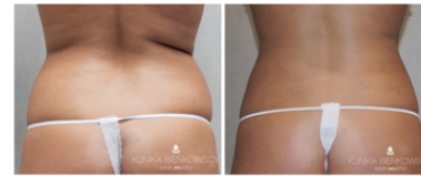
Przed zabiegiem N.I.L.