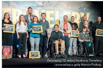
Zwycięzcy 12. edycji konkursu Travelery i prowadzący galę Marcin Prokop.