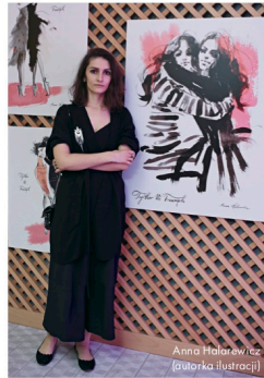
Anna Holawicz (autorka ilustracji)